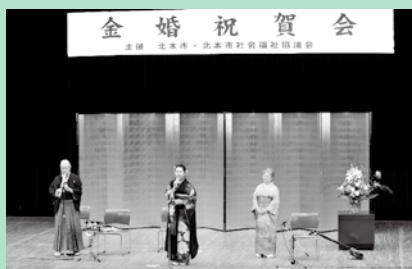
滝瀬ファミリーアトラクション