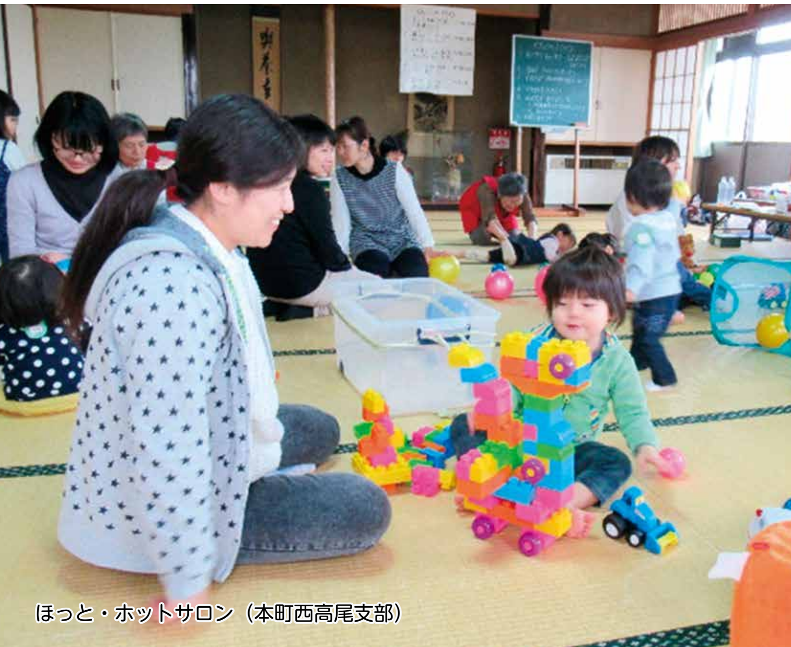
ほっと・ホットサロン (本町西高尾支部)