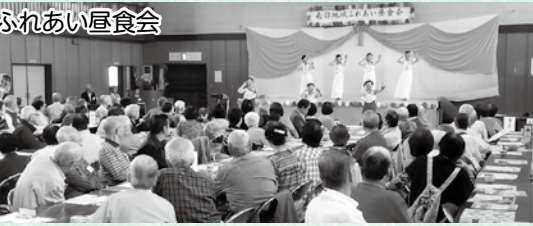
高齢者等が気軽に集まり、地域の人同士の繋がりを深め、近隣での助け合いを育む地域づくりを目指しています