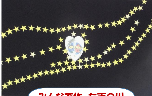
みんなで作った天の川