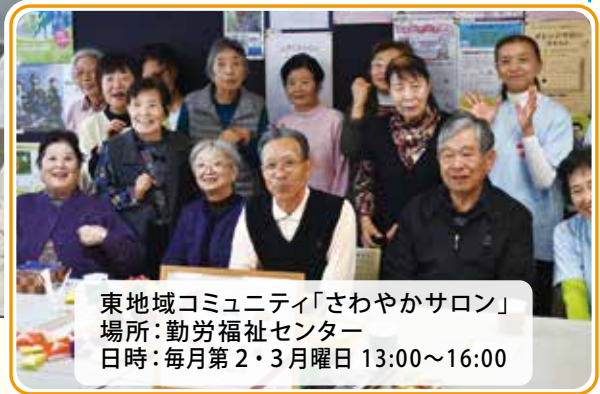
東地域コミュニティ「さわやかサロン」 場所：勤労福祉センター 日時：毎月第2・3月曜日 13:00～16:00