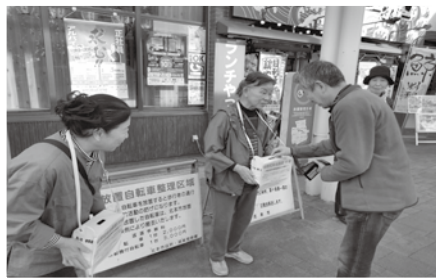
埼玉県内をはじめ全国で被災された 方への支援のための義援金を受け付 けしています。

義援金は、税制優遇措置の適用対象 となります。確定申告に際しては必 要書類があるため、お問合せください。