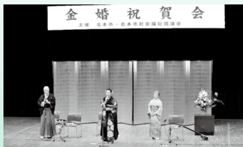
滝瀬ファミリーアトラクション

10月27日(日)、文化センターホールにおいて、北本市と北本市社会福祉協議会の共催で「金婚祝賀会」が開催されました。この祝賀会では、民生委員・児童委員協議会のご協力により、結婚50年を迎えた202組のご夫婦をお祝いしました。式典では、祝詞の授与や来賓からの祝辞をいただき、アトラクションでは、滝瀬ファミリーによる「津軽民謡の演奏」が披露され、楽しく賑やかなひとときとなりました。また、当日撮影したご夫婦の記念写真を後日配付し、大変喜ばれました。