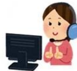
北本市社会福祉協議会 手話通訳者